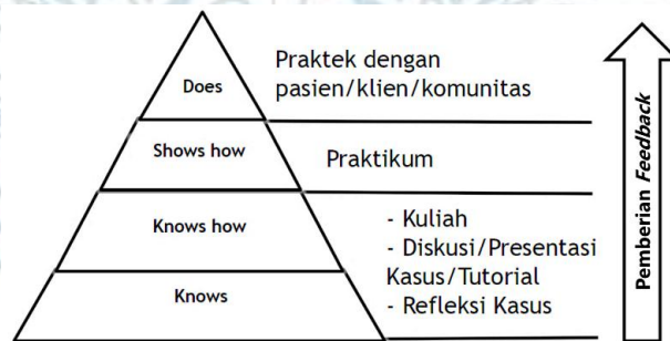
Gambar 1. Metode Pembimbingan Klinik

Metode pembimbingan klinik diilustrasikan pada gambar 1.